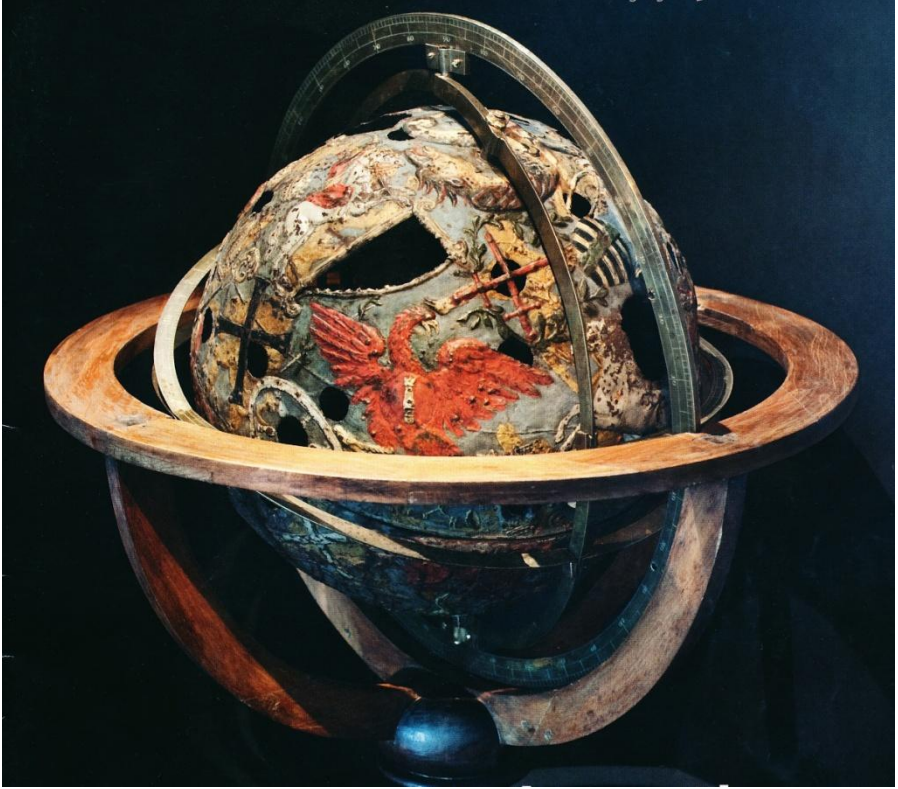
Heraldischer Himmelsglobus von Erhard Weigel (Trondheim, NTNU Vitenskapsmuseet)

Neben diesen kleinen Globen erfand Weigel den Typ eines „Planetariums“. Das ist eine bis zu 6 Meter im Durchmesser große Kugel, in die man hineingehen konnte, und in deren Eisenhülle Löcher gestochen und diese so angeordnet waren, daß am Tage das Sonnenlicht hindurchschien und der Betrachter im Inneren Sternbilder mit den angedeuteten Sternen bis zur dritten Größe erkannte. Weigel verband diese Himmelskugel mit etwas Technik im Inneren, das die Erde mit den verschiedenen Phänomenen (Vulkanausbruch, Blitz, Donner, Regen, Nebel) darstellte, und schuf so einen „Pancosmos“. Eine solche Himmelskugel ließ Weigel auf dem Dach des Jenaer Schlosses errichten.