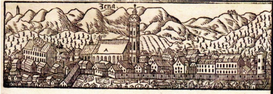
Jena mit Schloß (am linken Bildrand) und der großen Himmelskugel auf dem Schloßdach (aus Theophil Sternfreund: Geschichts=Calender für 1692)